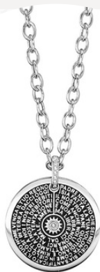
€40,00 Argento e pietra nera COLLANA CIONDOLO