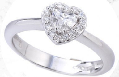
€25,00 ANELLO CON CUORE Argento e cristallo