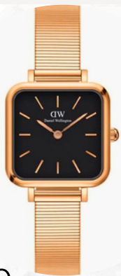
€70,00 Acciaio inossidabile OROLOGIO ECLISSI