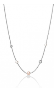
€25,00 Collana in argento con perle rosa, bianche ed argentate COLLANA CON CINQUE PERLE