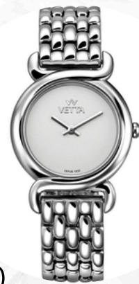
€45,00 acciaio OROLOGIO TRAMA