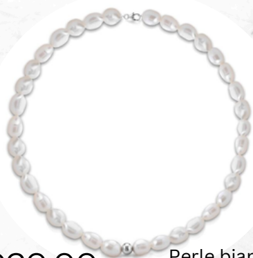
€20,00 Perle bianche, gancio in argento COLLANA DI PERLE