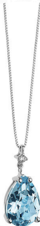
€45,00 Catena in argento stile veneziano, pendente di cristallo azzurro a goccia COLLANA COMETE