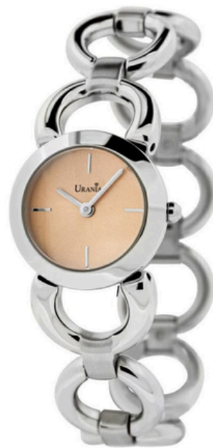
€65,00 OROLOGIO DI ACCIAIO Acciaio