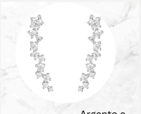
€25,00 Argento e cristalli ORECCHINI FASCIO