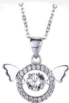
€30,00 Argento, cristalli e perno in argento COLLANA CON PENDENTE A CERCHIO E ALI