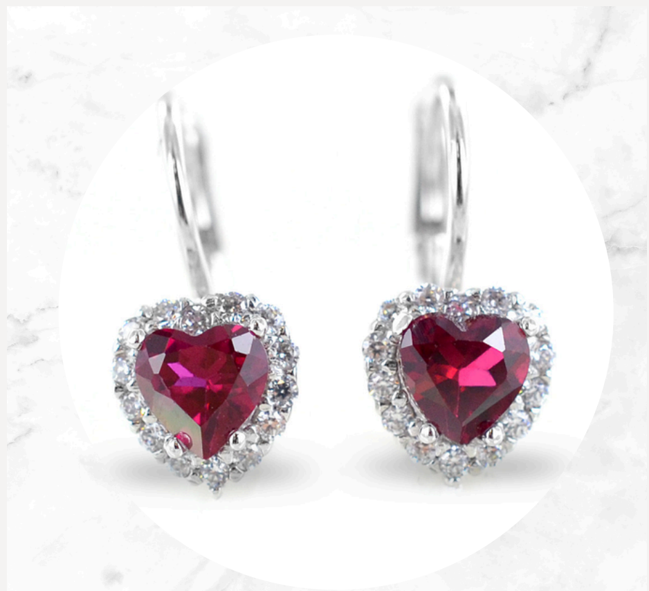
€40,00 Argento, cristalli rossi e bianchi ORECCHINI CUORE