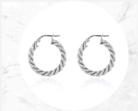
€35,00 Argento ORECCHINI CERCHIO