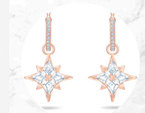
€26,00 Argento dorato e cristalli ORECCHINI STELLA