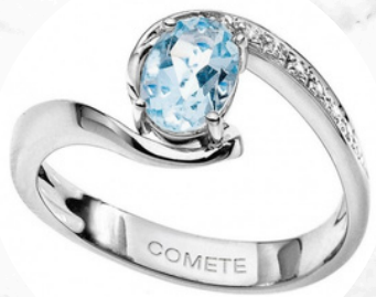
€26,00 ANELLO COMETE Oro bianco con cristallo azzurro