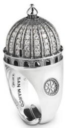
€35,00 ANELLO CUIPIOLA SAN MARCO Argento e cristalli