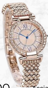
€85,00 Acciaio inossidabile e cristalli OROLOGIO AURORA