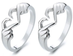
€20,00 ANELLI BFF Lega di zinco