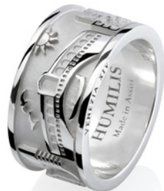
€40,00 ANELLO RIALTO Argento