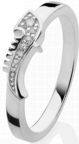
€40,00 ANELLO SESTIERE Argento e cristalli