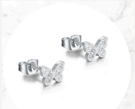
€20,00 Argento e cristalli ORECCHINI FARFALLA