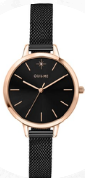
€90,00 Pelle e acciaio inossidabile OROLOGIO ECLISSI NERA