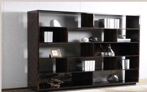
Libreria "Nebula" in legno: 2.199,99€