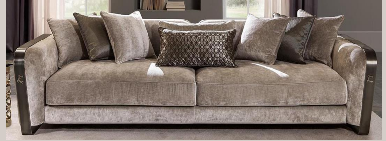
“Elogio della Semplicità” : 2.700,00€