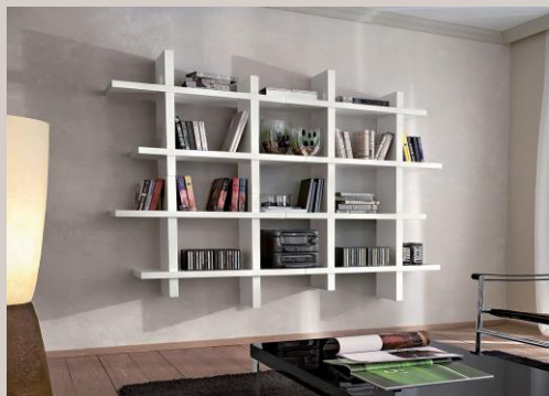
Libreria "Tris" in legno: 999,99€