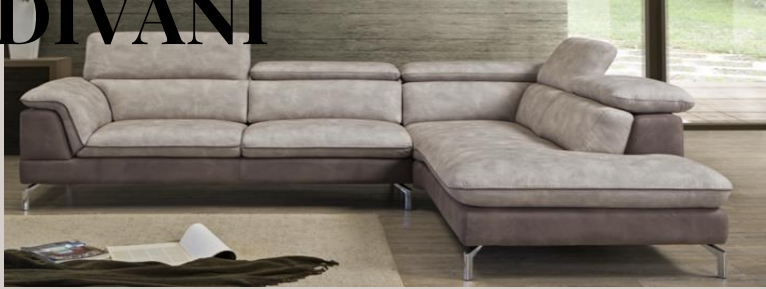
“Sogno di Mezzanotte” : 3.400,00€