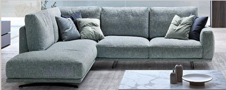
“Quieto Rifugio” : 2.893,00€