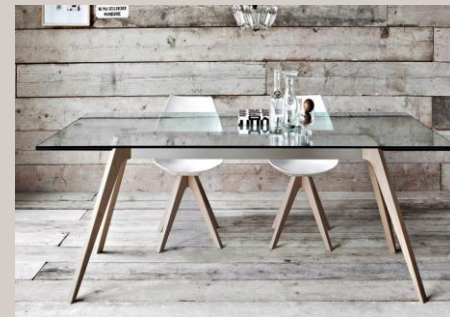
Tavolo “Aura” in legno : 999,99€ Tavolo “Sfera” in marmo nero : 2.200€ Tavolo “Milcu” in vetro: 899,99€