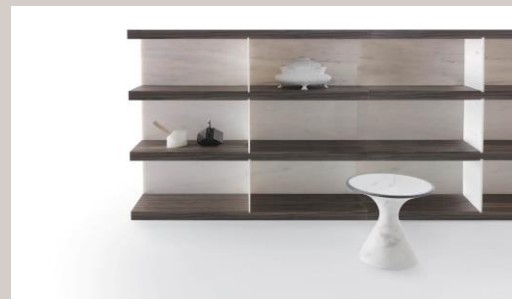
Libreria "Bagamias" in marmo bianco 4.999,99€