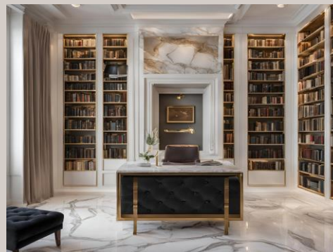
Libreria "Condor" in marmo : 8.199,99€