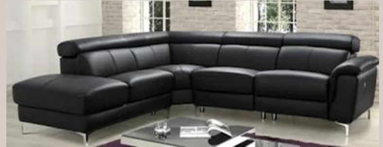
“Luce di Sera” : 3.298,00€